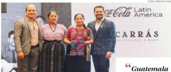
MUJERES DE SANTO DOMINGO XENACÓJ han recibido acompañamiento y formación de parte del diseñador, indicaron en rueda de prensa.